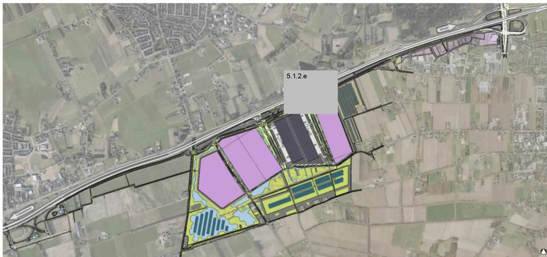
Figuur 1: Stedenbouwkundig ontwerp regionaal bedrijventerrein Heesch-West (bron: MER)

De Commissie adviseert deze informatie in een aanvulling op het MER op te nemen, en dan pas een besluit te nemen over de bestemmingsplannen. In hoofdstuk 2 licht de Commissie haar oordeel toe en geeft ze aandachtspunten voor het vervolgtraject.