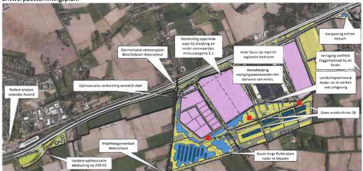
Figuur 1: Planaanpassingen van voorontwerpbestemmingsplan naar ontwerpbestemmingsplan

Op het voorontwerpbestemmingsplan Heesch West (2019) werden circa 1.300 inspraakreacties ontvangen. In de raadsinformatiebrief over het ontwerpbestemmingsplan is (in paragraaf 5.4 van de raadsinformatiebrief) beschreven hoe de omgevingsdialoog is gevoerd voor het plan. Ook beschrijven we daarin hoe deze omgevingsdialoog is geïntensiveerd tussen voorontwerpbestemmingsplan (2019) en ontwerpbestemmingsplan (2021), en hoe ingespeeld is op de ingebrachte zorgen. We verwijzen primair naar die paragraaf, maar hebben voor het overzicht hieronder in figuur 1 de belangrijkste wijzigingen opgenomen die als gevolg van de participatie werden doorgevoerd in de fase van voorontwerp naar ontwerpbestemmingsplan: