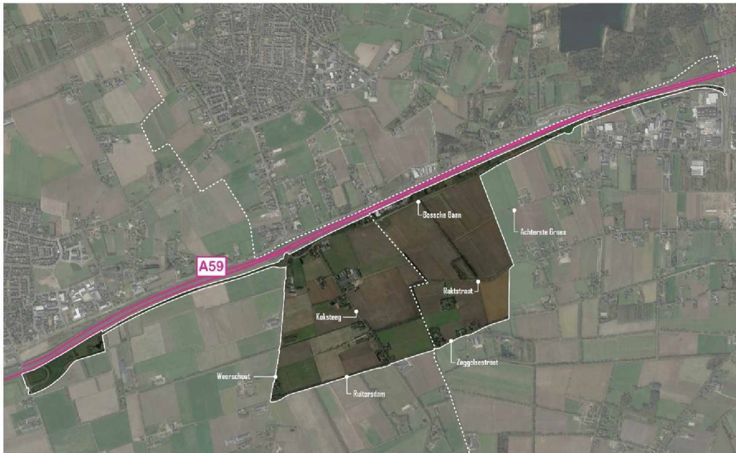
Figuur 1 - Plangebied ontwerp bestemmingsplan Heesch West