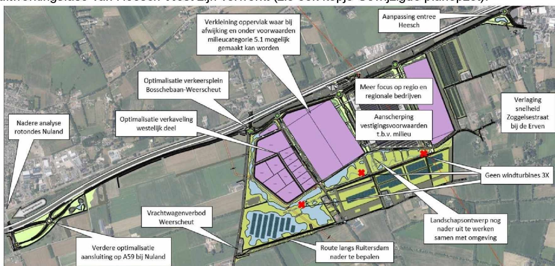
Figuur 3: planaanpassingen